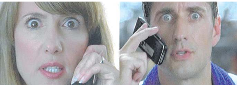
Les épisodes Beck&Bondi de Swisscom Fixnet rassemblent ceux qui s'assemblent.